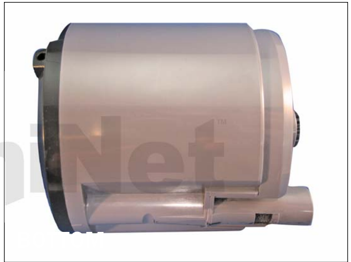
2. Vista lateral del cartucho de toner.