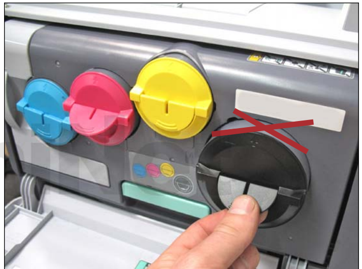
6. Notar la posición del cartucho ya en su módulo de imagen con la flecha hacia arriba. El espacio disponible en el domo es muy estrecho. Es importante no agujerear en cualquier parte de esta línea axial pues al insertar el cartucho se puede despegar el sello y como consecuencia causar eventuales pérdidas de tóner.

NOTA: No agujerear sobre o cerca del borde superior del cartucho donde se encuentra apuntando la flecha.