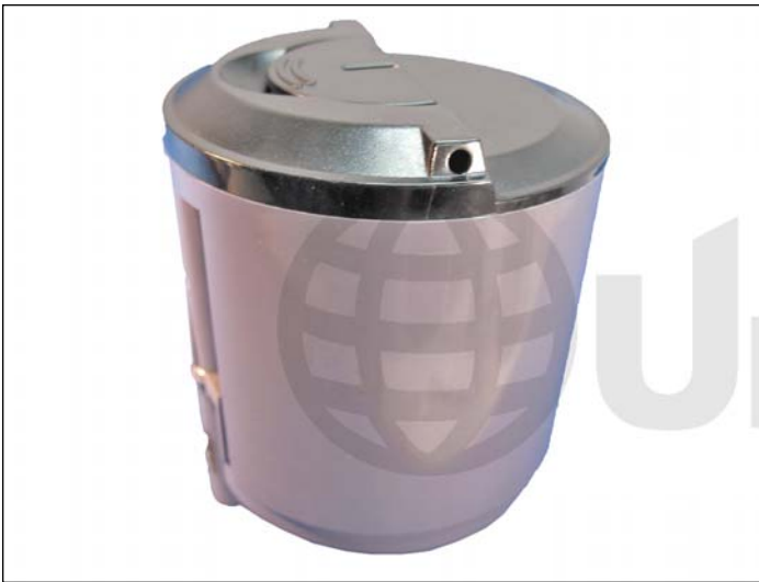
1. Cartucho Xerox Phaser 6110 mostrado con su tapa soldada.

El cartucho no es desarmable y su recarga se lleva mejor a cabo agujereando el cuerpo de una forma específica para proceder a su limpieza y recarga. El orificio practicado se obtura luego con un fino sello autoadhesivo.