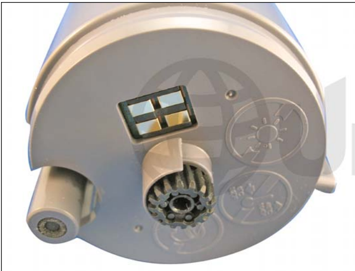
3. Fondo del cartucho mostrando su chip, engranaje del eje de agitación y boquilla de salida de toner