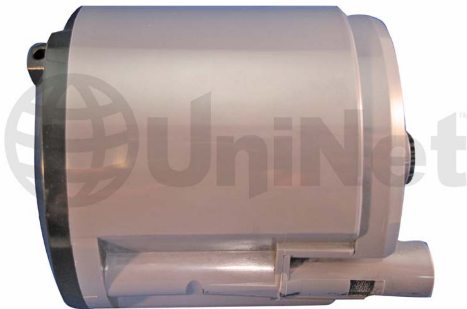
CARTUCHO DE TONER XEROX® PHASER 6110